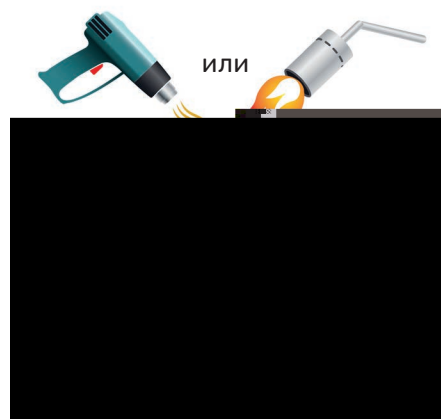
Рабочий процесс усадки